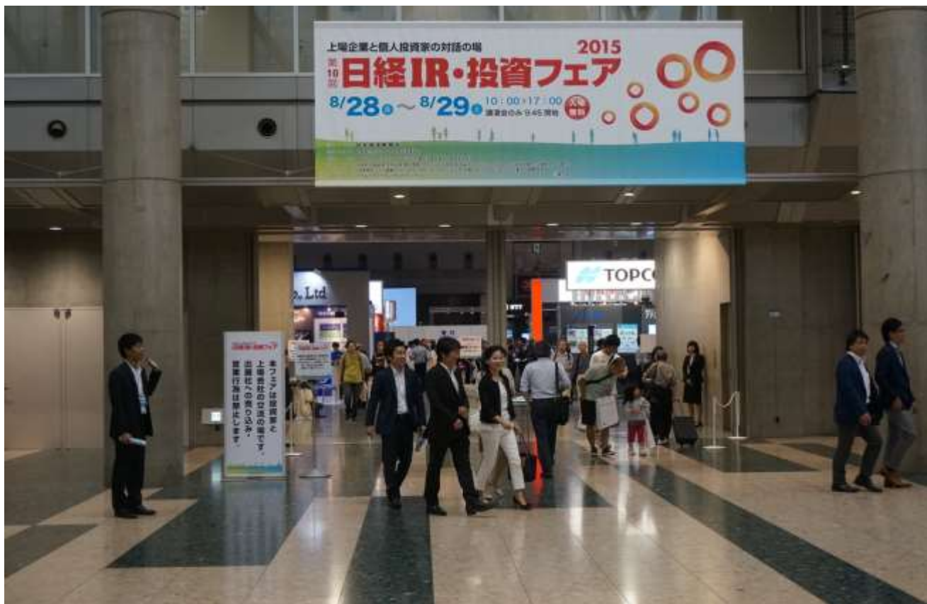
当社ブースの様子 | 第 10 回日経 IR・投資フェア 2015 会場