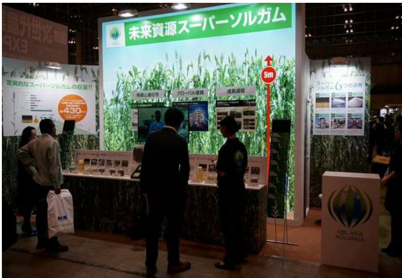
04.「農業ワールド 2015 | 第2回 国際次世代農業 EXPO」 当社ブース/展示物